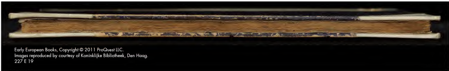
227 E 19